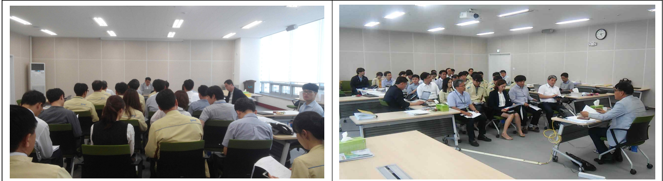
감사결과 마감회의 및 반부패·청렴교육